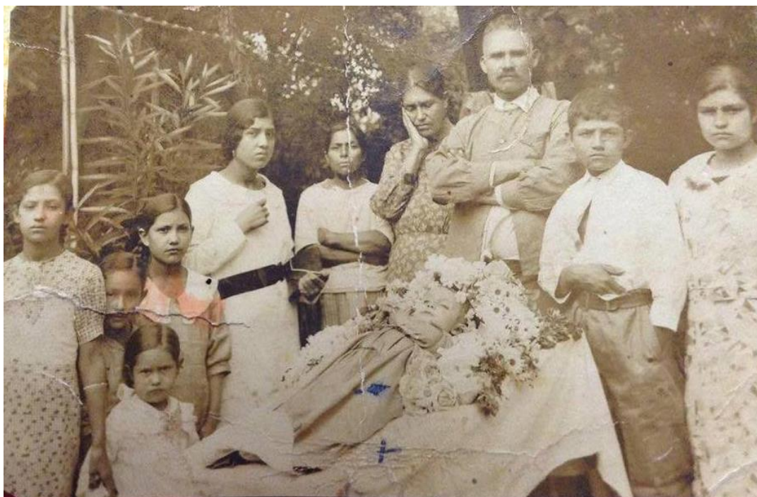
En esta imagen se observa a la familia de mi abuela materna, que es la niña más pequeña situada en la esquina inferior izquierda; en ella se puede apreciar a un