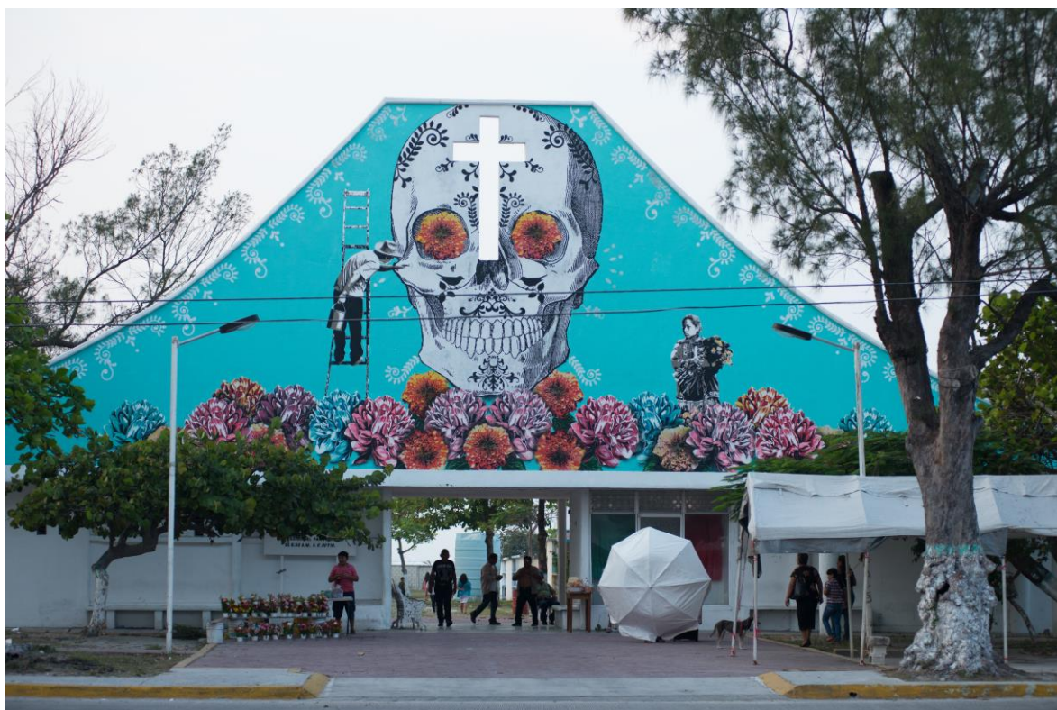
Perspectiva completa de la fachada del Panteón municipal de Ciudad del Carmen, Campeche, México.

Si hablo de un árbol, ningún árbol sale sin embargo de mi boca, pero al evocarlo en su ausencia, lo presentifico en nuestra escucha (Dominique, 1999: 61), volviéndose así aunque no de forma tangible presente en el momento, al igual que con las fotografías, las cuales juegan un papel importante dentro de los rituales, presentaciones y remembranzas de las personas fallecidas; haciendo posible el propósito del mexicano que es no dejar en el olvido la memoria de sus seres queridos.