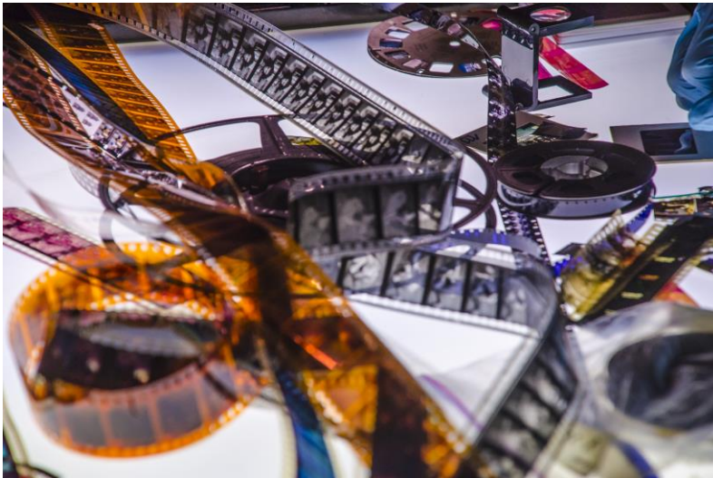
Rollos y cintas de películas de nitrato y acetato en distintos formatos, 8, super 8, 16, 35 y 70 mm.

En este subtema se tiene como objetivo la comparación de la imagen-materia con la imagen-filme, en la medida que es el registro que se va a analizar y conceptualizar, como ya se indicó en la introducción, al ir de un video a fotografías.