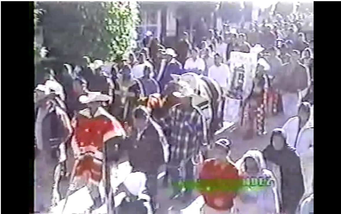
Imagen extraída del video del funeral de Everardo Ortíz. Escaramuza de familiares y amigos, personas del pueblo, jinetes y caballos.

difunto y la banda de viento, avanzan a un paso lento recorriendo las calles del pueblo para que el viajero se despida de su tierra que lo vio nacer y las personas que no acudieron vean el desfile y la importancia del individuo con muestras del cariño que se le tenía, éstas se manifiestan con las decenas de coronas y los cientos de personas que lo acompañan.