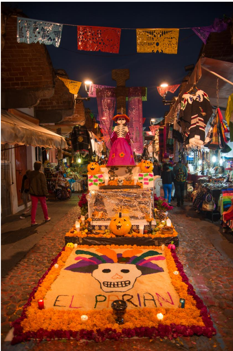
Altar de muertos, montado el 2 de noviembre en medio de un mercado en la ciudad de Puebla, Puebla, México.

permanecen vivos necesitan para no sentir el vacío de quien ya partió; se tiene el deseo de seguir sintiendo de algún modo que permanece en el mundo terrenal con los que se encuentran con vida. Dependiendo de las enseñanzas y cultura que tenga la sociedad que ha presentado la pérdida es que se llevan las festividades del ser querido. Aunque se habla de un momento que es de tristeza, el mexicano actual encontró la manera de llevarlo a festejo para poder enfrentar el duelo, haciendo que la muerte sea apartada de ese proceso natural al que todos llegan y convertirlo en un pasaje a un comienzo diferente y desconocido para los seres humanos.