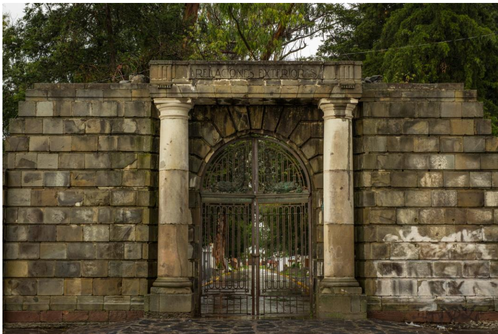
Fachada del panteón municipal de Almoloya de Juárez, Estado de México, México.

La fachada de este lugar originalmente perteneció a la oficina de la Secretaría de Relaciones Exteriores, ubicada en la calle Benito Juárez, en el centro de la Ciudad de México; posteriormente fue donada al municipio de Almoloya y colocada en el panteón, lo cual recrea de forma cómica la entrada al "más allá".