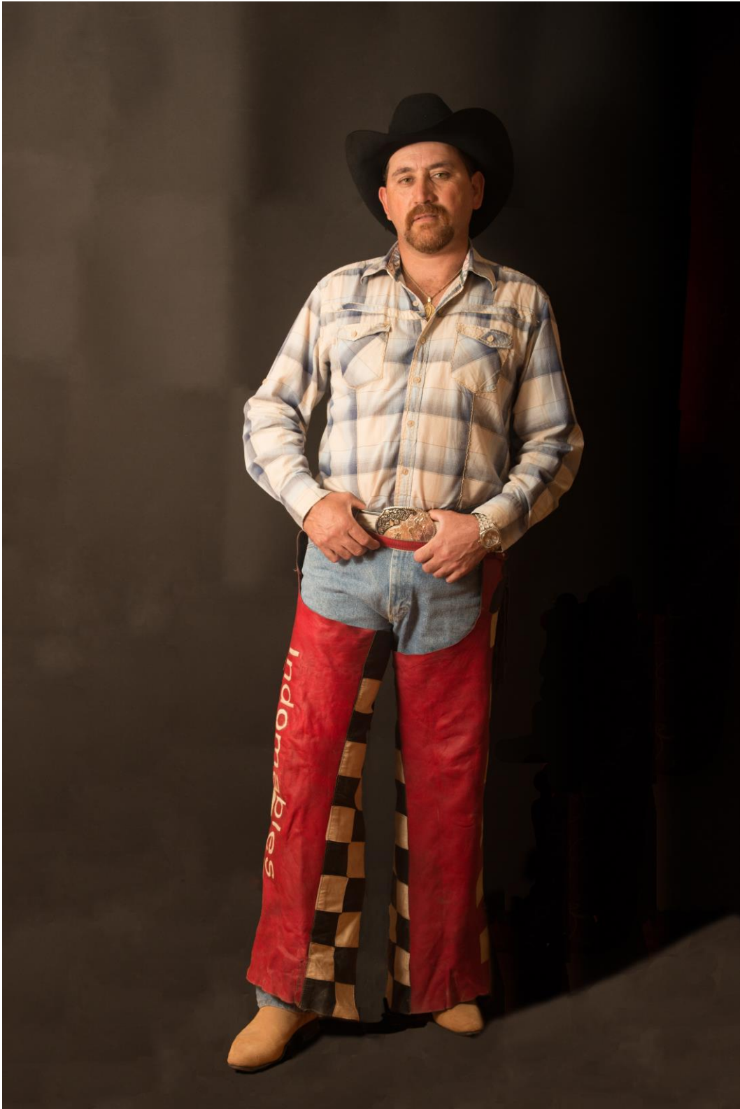
Vestimenta de gala de jinete de la cuadrilla “Los indomables de Everardo Ortíz”.