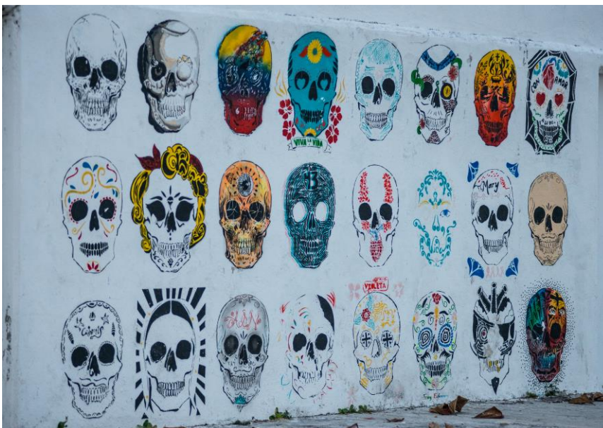
Muro del panteón municipal de Ciudad del Carmen, Campeche, México. En la imagen se muestra la representación de la muerte y sus diferentes facetas dentro de la "mexicanidad".

Claro que la manera en que se confronta la muerte actualmente ha sido un proceso social de miles de años, de religiones diferentes y el cómo el ser humano puede asimilar mejor el dolor que siente; pero esto no quiere decir que la sepultura de nuestros semejantes sea un rito actual; el hombre prehistórico ya se preocupaba por los cadáveres de los suyos, el momento [...] en que la muerte se hace consciente, y viene señalado por la aparición de las primeras sepulturas; la fecha es mucho más tardía, ya que en principio se trata de cien mil años antes de nosotros (Bataille, 1997: 48) . El hombre prehistórico se mostró un ser sensible a través de las pinturas realizadas en sus cavernas, donde celebraban sus ceremonias de encantamiento, según Bataille en Las lágrimas de Eros ; el primero en mostrarse sensible ante la muerte y preocuparse por los restos de sus compañeros caídos fue el hombre Neanderthal, conocido también como Homo Faber que quiere decir Hombre obrero; seguido de él, el Homo Sapiens quien dentro de sus costumbres funerarias tenía una conciencia de la muerte.