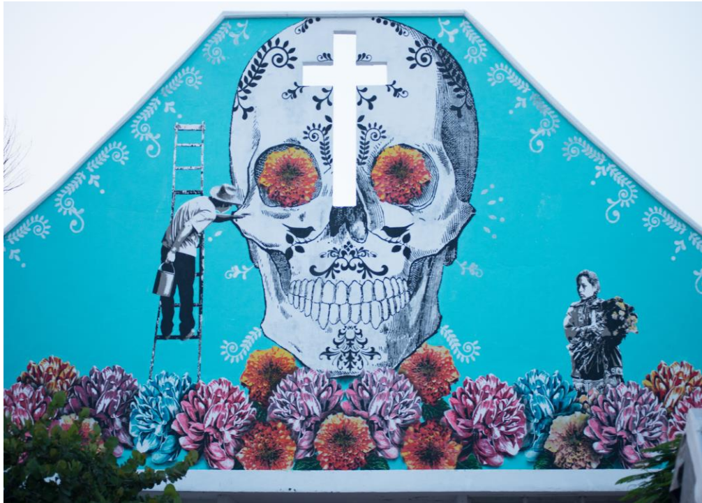
Fachada del panteón municipal de Ciudad del Carmen, Campeche, México.