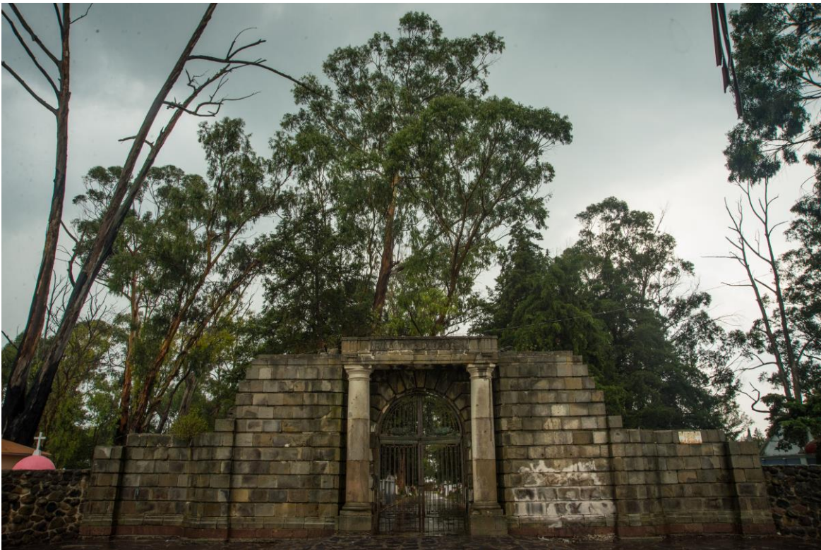
Otra perspectiva más completa de la fachada del Panteón municipal de Almoloya de Juárez, Estado de México, México.

En conclusión, a pesar de que la muerte es un suceso natural por el cual todo el mundo debe pasar, es dependiendo de la abstracción, la determinación de características pertinentes, no una mera suma de características comunes (Zamora, 2006: 55) es que ésta llega a ser vista y considerada; la muerte no significaba el fin de la vida, sino una simple transformación de ésta: no existe una discontinuidad entre la vida y la muerte. Se piensa que el muerto duerme, descansa, que se encuentra en un estado de sueño, en una vida sin conciencia que no es del todo diferente a la de este mundo, sino que simplemente tiene una menor densidad de existencia.