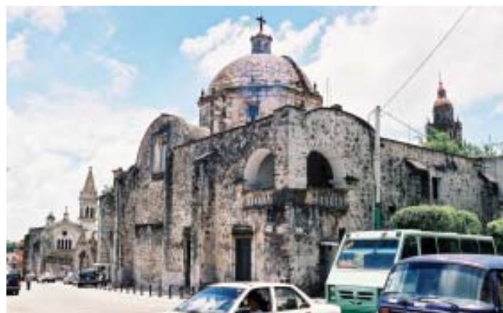
Catedral de Cuernavaca.

Consta de cinco partes. En la primera se refiere a los antecedentes sobre el problema, particularmente los referidos a los planteamientos sobre globalización y metropolización, y, para la MM, una breve presentación de algunos planteamientos al respecto; el segundo, trata sobre el proceso de reestructuración económica de la MM de los ochenta a la fecha; el tercero, vincula dicho proceso con su referente territorial que privilegia el análisis según ejes sobre el de contornos sucesivos; en el