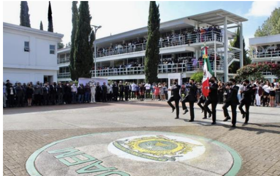
Fig. 4. Escolta del Plantel durante la ceremonia del 50 Aniversario, 1 de septiembre de 2022. Tenancingo, Plantel “Dr. Pablo González Casanova”.

páginas no se pueden recapturar dos veces; mas no impiden deslumbrarnos con su esencia en constante construcción.