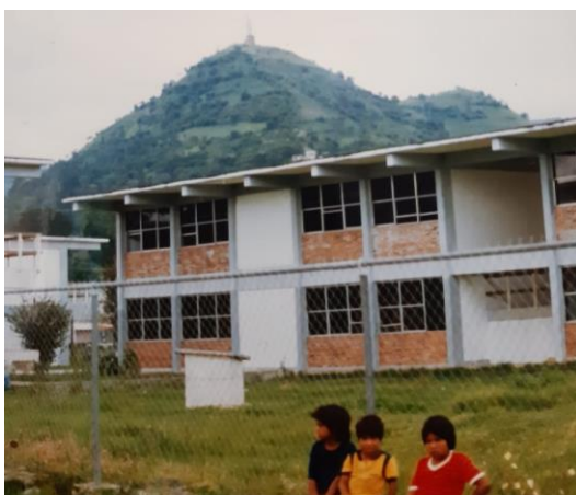
Fig. 6. El Plantel a principios de la década de los noventa, 1991 aprox. Tenancingo, Plantel “Dr. Pablo González Casanova”.

solidez académica y responsabilidad social, estando ad doc con el mensaje que el propio Dr. Pablo González Casanova dejó a la comunidad del Plantel en su última visita en 2005: “estoy seguro que de Tenancingo y esta escuela saldrán muchos de los grandes constructores de un México más justo y más libre” (fig. 7).