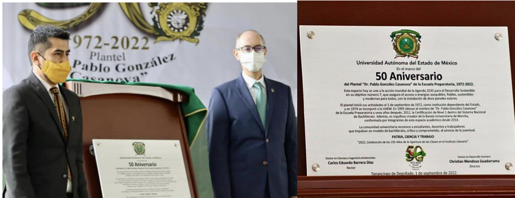
Figs. 1 y 2. A la izquierda, Rector y Director develando la placa conmemorativa; a la derecha, placa del 50 aniversario del Plantel, 31 de agosto de 2022. Tenancingo, Plantel “Dr. Pablo González Casanova”.

El prelude dejó insatisfechos a los estudiantes, pues querían prolongar la fiesta; pero con la certeza de que habría más sorpresas al siguiente día. No eran vanas esperanzas, en redes sociales ya circulaba que el jueves sería de “vestimenta formal” (fig. 3), actividad lúdica que comenzaba a ser tradición en el 2022 y que había sido un rotundo éxito en sus anteriores ediciones; por lo tanto, los estudiantes esperaban con alegría el 1 de septiembre para el inicio formal de las festividades.