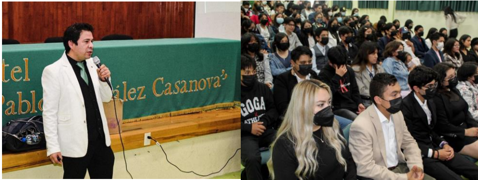
Figs. 12 y 13. A la izquierda, cronista impartiendo la conferencia; a la derecha, público en el auditorio del Plantel, 1 de septiembre de 2022. Tenancingo, Plantel "Dr. Pablo González Casanova".

En la primera se dio un breve repaso por la historia del Plantel y se destacaron algunos de los datos más relevantes de la biografía de González Casanova. En la segunda, se invitó a los estudiantes a conocer algunos de los símbolos e íconos que tiene la preparatoria. Los estudiantes terminaron por agradecer más la segunda que la primera parte, ya que el contacto directo o casi directo con los símbolos identitarios creó en ellos una reflexión más profunda.