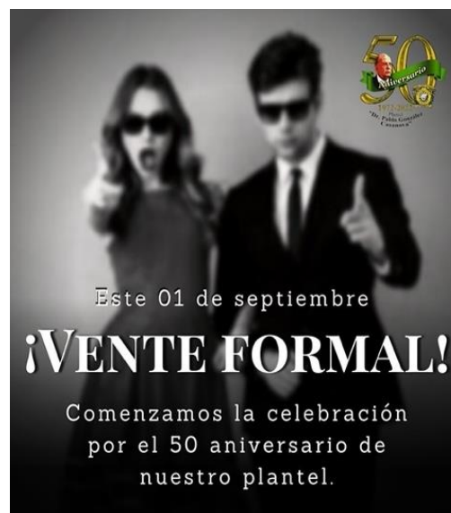
Fig. 3. Flyer para la actividad lúdica del 50 aniversario, 22 de agosto de 2022. Tenancingo, Plantel “Dr. Pablo González Casanova”.

El prelude dejó insatisfechos a los estudiantes, pues querían prolongar la fiesta; pero con la certeza de que habría más sorpresas al siguiente día. No eran vanas esperanzas, en redes sociales ya circulaba que el jueves sería de “vestimenta formal” (fig. 3), actividad lúdica que comenzaba a ser tradición en el 2022 y que había sido un rotundo éxito en sus anteriores ediciones; por lo tanto, los estudiantes esperaban con alegría el 1 de septiembre para el inicio formal de las festividades.