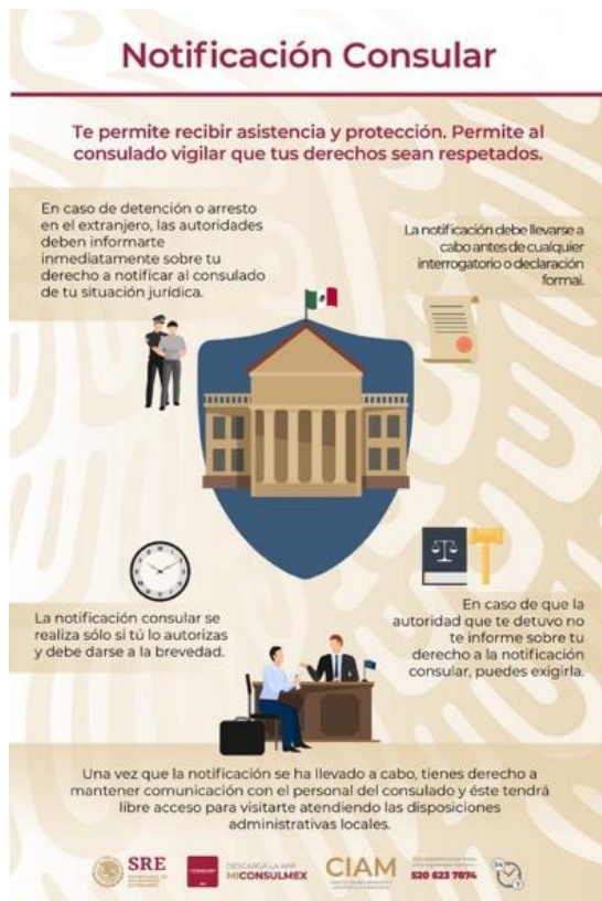
Ilustración 4: Notificación Consular SRE.2018. (Secretaría de Relaciones Exteriores de México, 2019)

a) Composición y jerarquías visuales y contenidos :