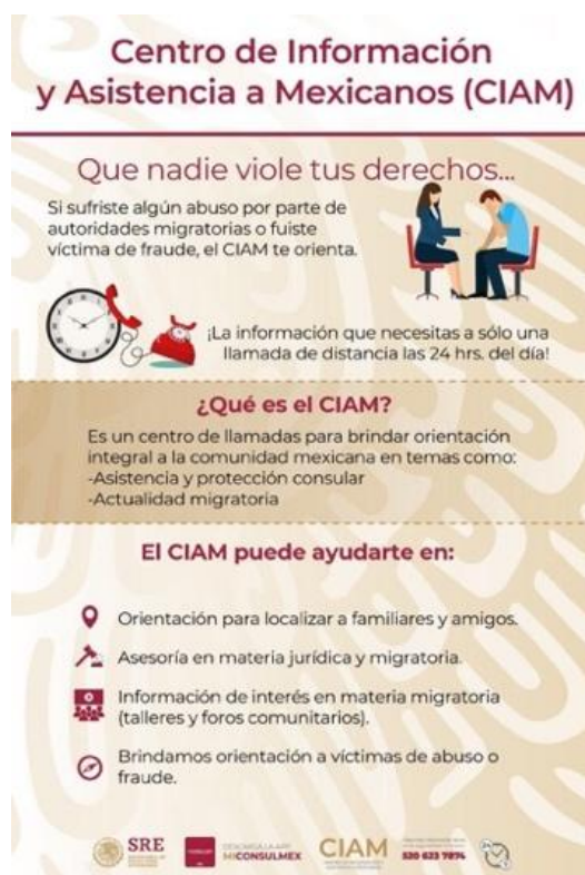
Ilustración 2: Que nadie viole tus derechos SRE 2018.. (Secretaría de Relaciones Exteriores de México, 2019)

a) Composición y jerarquías visuales y contenidos: