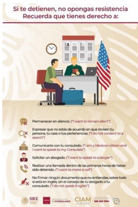
Ilustración 3: Si te detienen no opongas resistencias SRE. 2018. (Secretaría de Relaciones Exteriores de México, 2019)

un hombre con vestimenta casual y una maleta (equipaje) junto a él, atendiendo a la autoridad. Ninguno de las dos personas muestran un rostro específico (no hay ojos, boca, ni nariz) posiblemente para dar a entender que puede ser cualquier persona; sin embargo el de uniforme si tiene una tez blanca y cabello claro no así el que representa al migrante. Este bloque se distingue por un fondo con una tinta en trama que da un fondo de color sutil con una textura.