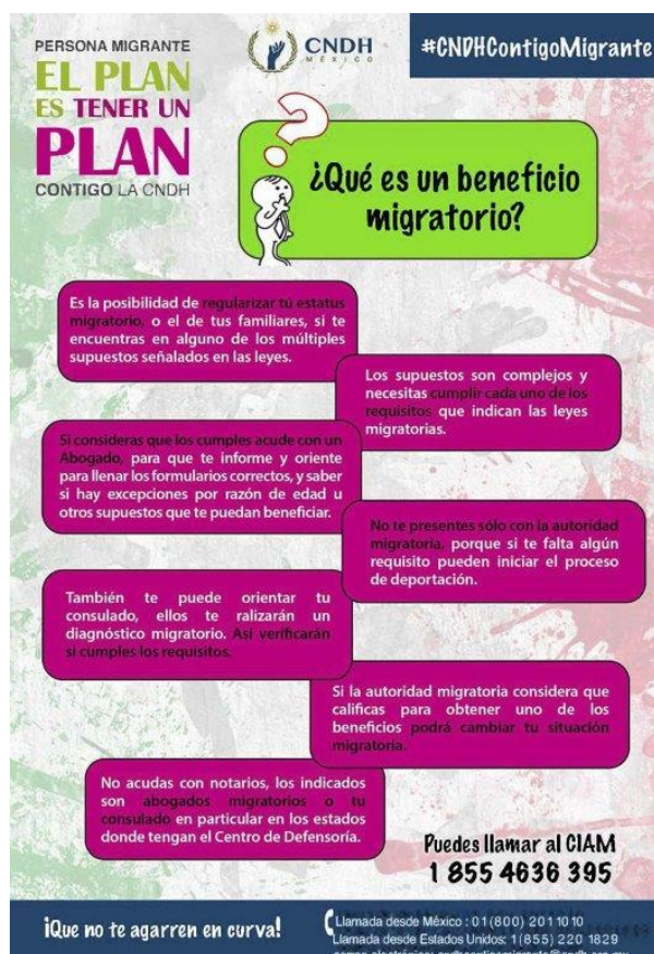
Ilustración 5: ¿Qué es un beneficio migratorio CNDH2018 (Comisión Nacional de los Derechos Humanos, 2018)

a) Composición y jerarquías visuales y contenidos: El cartel tiene una secuencia de lectura con dirección superior-inferior y de izquierda a derecha guiada por la jerarquía del tamaño de los títulos, la composición tipográfica, el manejo del color y el tamaño de recuadros con color en diferentes tamaños; a la par se maneja una pleca de color en la parte inferior con el nombre de la campaña y los datos de contacto.