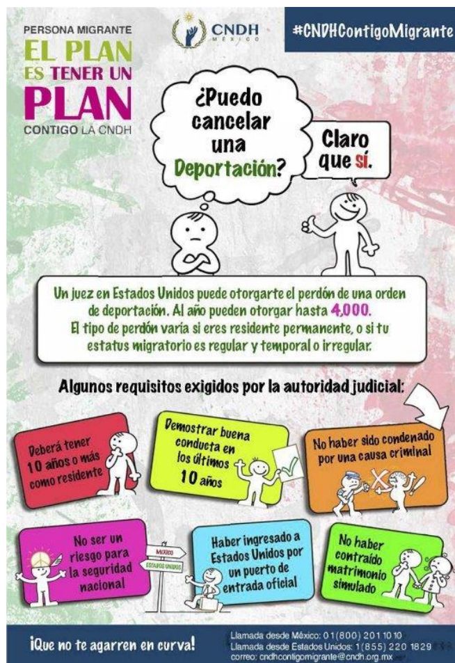
Ilustración 6: ¿Puedo cancelar una deportación? CNDH 2018 (Comisión Nacional de los Derechos Humanos, 2018)

Respecto al contenido de los recuadros se encuentran tres recuadros con los puntos generales del tema y en uno de ellos el título que evidencia el tema informativo: ¿Puedo cancelar una deportación? Y su respuesta. Posteriormente se encuentran 6 recuadros con la información vinculada que responde a la pregunta y que da varias recomendaciones relacionadas en diferentes colores de fondo.