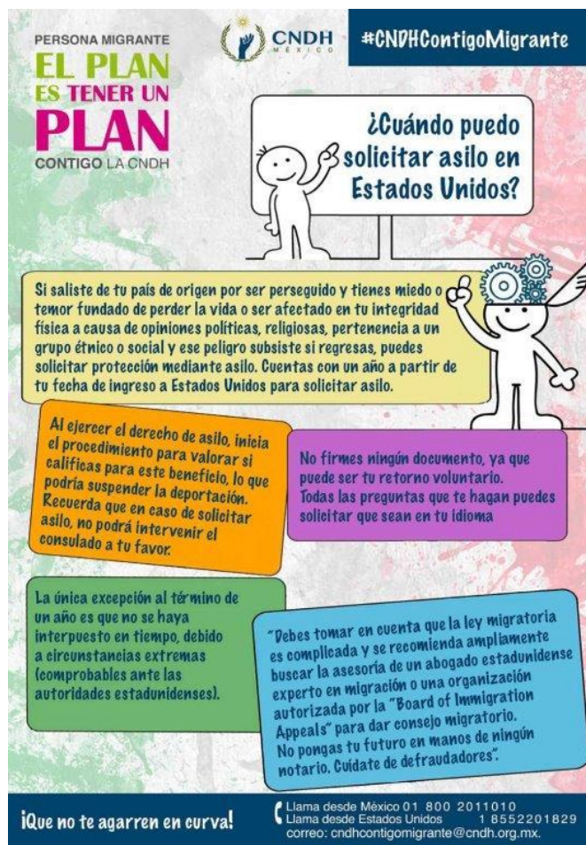
Ilustración 7: ¿Cuándo puedo solicitar asilo en los estados unidos? CNDH 2018. (Comisión Nacional de los Derechos Humanos, 2018)