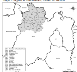
Mapa 1. Región II Atlacomulco, Estado de México

En aspectos demográficos, aún perviven pueblos originarios de cuatro etnias: mazahua, otomí, tlahuaca y malatzinca. Resulta particularmente interesante que sus territorios sean áreas de protección ambiental donde se les restringe—sin acompañamiento—no sólo el uso, también las prácticas y el manejo de sus recursos naturales. Los municipios con mayor presencia de grupos originarios se sitúan en la parte centro, norte, noroeste y sureste del estado. El mapa 1 muestra una de las regiones estudiadas.