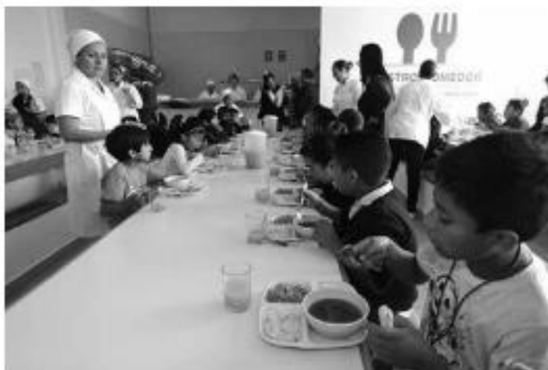
Fotografía 3. Uno de los comedores de zonas urbanas propios del programa Cruzada nacional contra el hambre